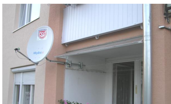
príklad aplikácie RPM 1150 a PLZ3M ( montáž SAT paraboly )